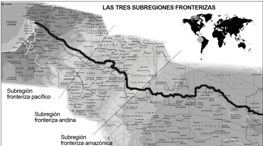
MAPA 1. LAS TRES SUBREGIONES FRONTERIZAS (COLOMBIA – ECUADOR)

Mapa intervenido por la autora.